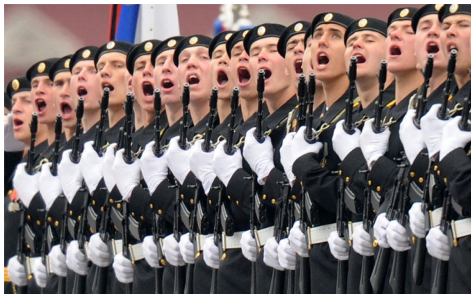
Eine Ehrengarde in Moskau

Gekürzt, ursprünglich erschienen am 24.1.2013