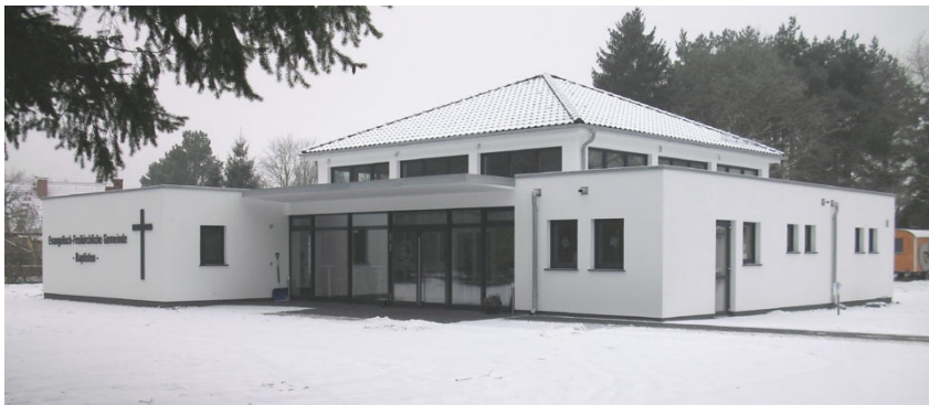
Neubau der EFG Zeesen am 15.1.2013